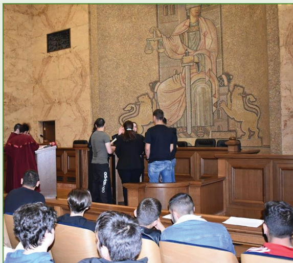
Автори на рисунките са ученици – участници в конкурс на Районен съд - Добрич.

Наказателната отговорност не се изчерпва с изтърпяване на наказанието. Влязлото в сила осъждане за извършено престъпление се вписва в т. нар. „Свидетелство за съдимост“, което се изисква при постъпване на работа, тъй като чистото съдебно минало е законово условие за заемане на много длъжности.